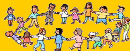
イラスト／OP 中畝 治子

催で、利用者や家族、市民や関係機関などを対象に、学識経験者を交え、福祉サービスの課題や権利擁護についての啓発活動を行っています。